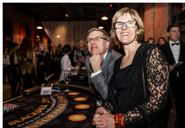
Notre gala signature, Skyball