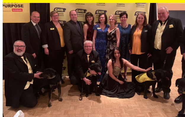
Le gala « Guide Dogs with Purpose »